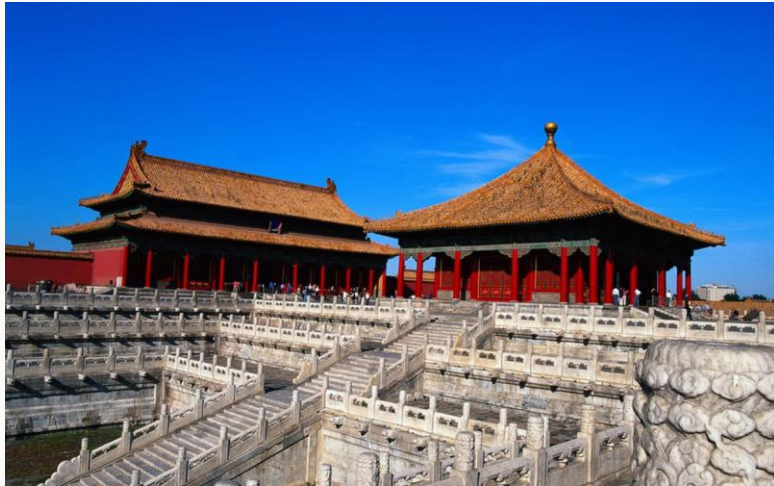
故宫 (紫禁城, Forbidden City)