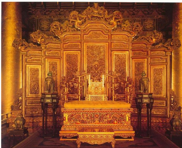
故宫 (紫禁城, Forbidden City)