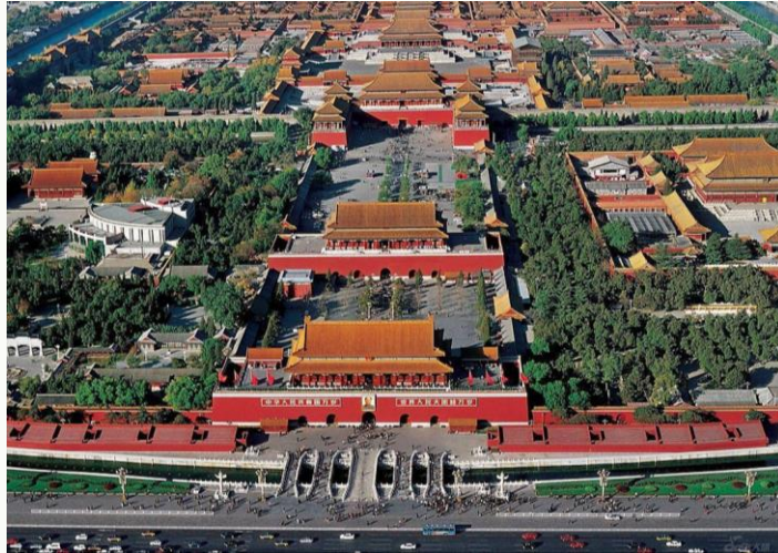
故宫 (紫禁城, Forbidden City)