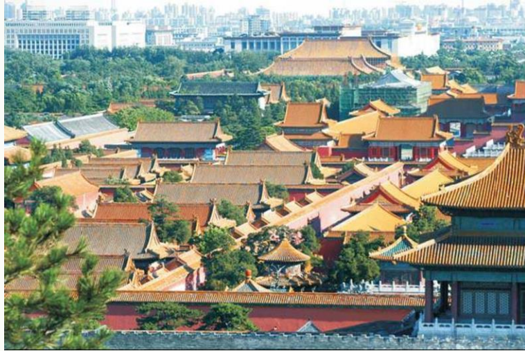
故宫 (紫禁城, Forbidden City)