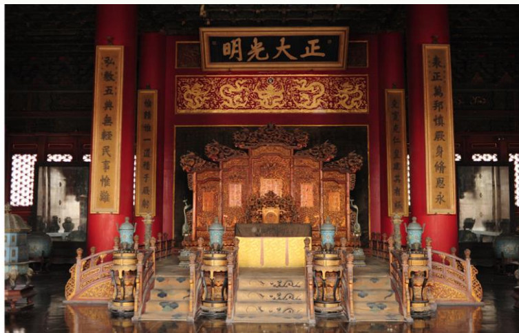
故宫 (紫禁城, Forbidden City)