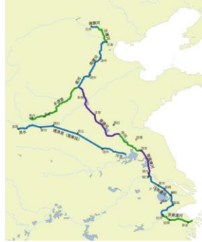
大运河 Grand Canal

隋文帝开皇七年（587年），隋为兴兵伐陈，从今淮安到扬州，开山阳渚，和广通渠后又整治取直，中间不再绕道射阳湖。隋炀帝大业元年605年，开通济渠，工程西段自今洛阳西郊引谷、洛二水入黄河，东段自荥阳汜水镇东北引黄河水，循汴水（原淮河支流），经商丘、宿县、泗县入淮通济渠，又名汴渠，是漕运的干道。隋炀帝大业四年608年又开水济渠，引黄河支流沁水入今卫河至天津，继溯永定河通今北京。公元610年继开江南运河，由今镇江引江水经常州、无锡、苏州、嘉兴至杭州通钱塘江。至此，建成以洛阳为中心，由水济渠、通济渠、邗沟和江南运河连接而成，西接大兴，南通余杭，北通涿郡，全长折今2700余公里的大运河。